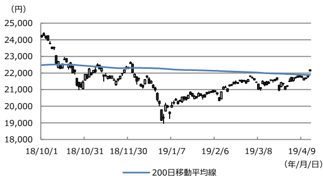
【図表1：日経平均株価の200日移動平均線】

(注) データは2018年10月1日から2019年4月15日。ただし4月15日は11:30まで。