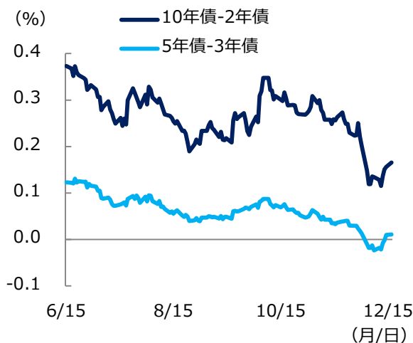
米国債利回り格差の推移