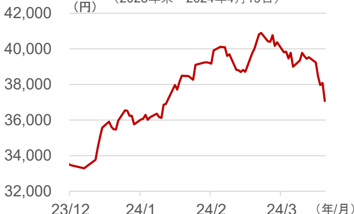
フィラデルフィア半導体株指数の推移