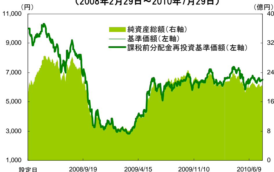
【基準価額と純資産総額の推移】 (2008年2月29日～2010年7月29日)

* 基準価額は、信託報酬控除後、信託財産留保額控除前、課税前です。 * 上記グラフは過去の実績であり、将来の運用成果をお約束するものではありません。 * 課税前分配金再投資基準価額とは、基準価額に各収益分配金(課税前)を、その分配が行われる日に全額再投資したと仮定して算出したものであり、当社が公表している基準価額とは異なります。